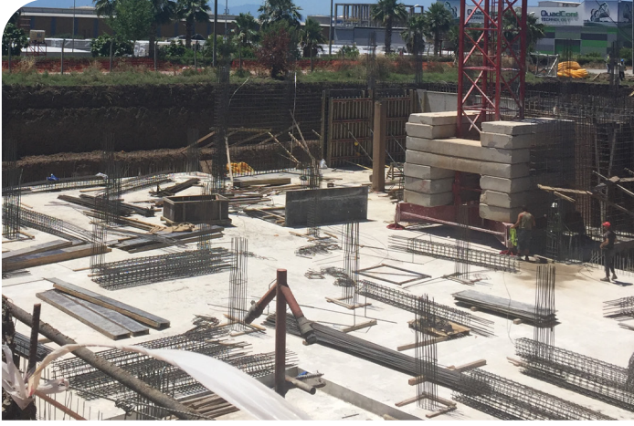
İdari bina bitmesi sonrasında binanın görünüşü;

İki ana blok biçiminde tasarlanmış olan idari bina projesinin ana bloklarının birinde Gümrük Müdürlüğü ve Serbest Bölge Müdürlüğü bulunmaktadır. Diğer ana blokta ise zemin katta ortak kullanımlı konferans salonu bulunmakta olup, 1. katında ise Tayseb İdari Ofisler yer alacaktır. Projenin 2019 yılı sonunda tamamlanması hedeflenmektedir.