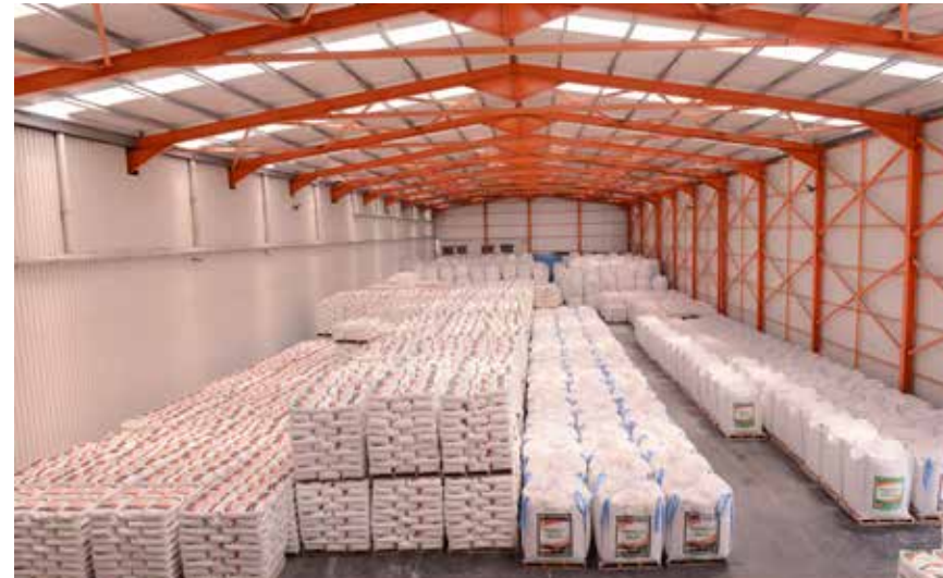
LOREM IPSUM DOLOR SIT AMET, CONSECTETUR ADIPISCING ELIT