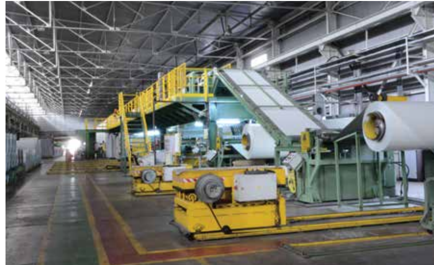
LOREM IPSUM DOLOR SIT AMET, CONSECTETUR ADIPISCING ELIT