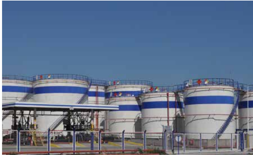
LOREM IPSUM DOLOR SIT AMET, CONSECTETUR ADIPISCING ELIT