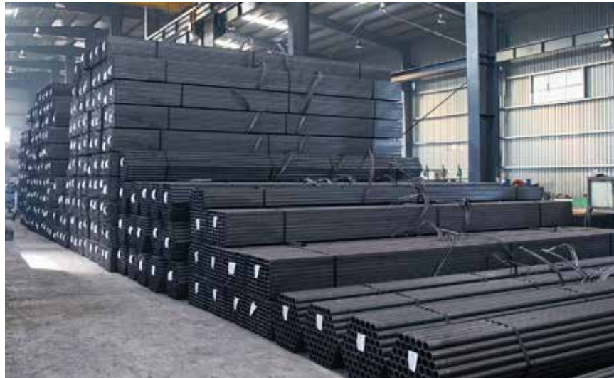
LOREM IPSUM DOLOR SIT AMET, CONSECTETUR ADIPISCING ELIT